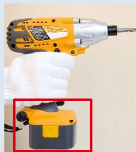
操作部の表示に使用